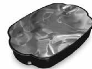
Composition de la barquette avant évolution : 99% de PP et d'1% de noir de carbone