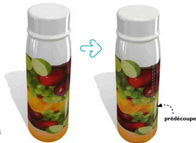
Flacon au corps PET + manchon en OPP