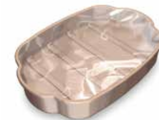
Composition de la barquette après évolution : 97% de PP et de 3% de colorant blanc